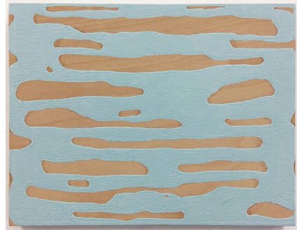
C. Vogel, ohne Titel, 20 x 30 cm, Acrylfarbe auf Holz, 2018